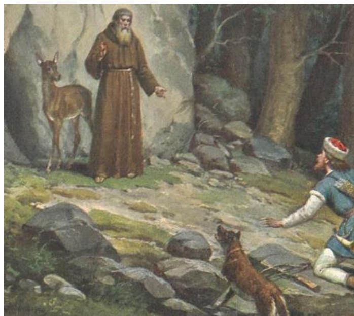
sv. Prokop a kníže Oldřich

V okolí kláštera se traduje , že Prokop bojoval s ďáblem. Údajně s jeho pomocí zoral pole a také vytvořil brázdu. Může být náhoda, že poblíž bývalého kláštera v městečku Sázava se skutečně nalézá podivná rýha – kdysi dlouhá několik kilometrů? Již stovky let se jí mezi místními neřekne jinak než Čertova brázda. Ale souvisí její vznik s Prokopem? Podle názoru většiny historiků vznikla ze zcela jiného důvodu. „Patrišně šlo o dálkovou obchodní, ale možná i rituální cestu, neboť propojuje několik pravěkých pohřebišť a posvátných vodních pramenů. Ještě na počátku 20. století se jako výrazná linie vinula krajinou od Chotouně,